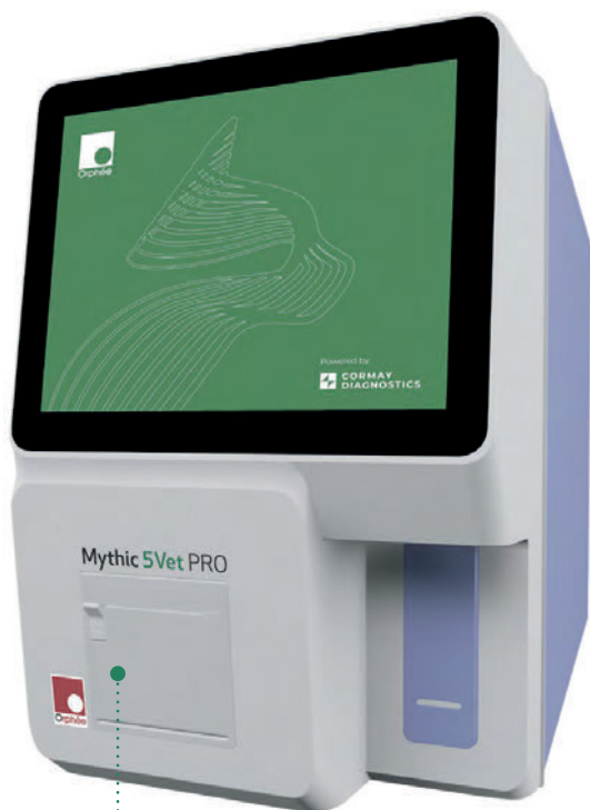
НОВИНКА 5-DIFF MYTHIC 5VET PRO