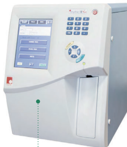
3-DIFF MYTHIC 18VET